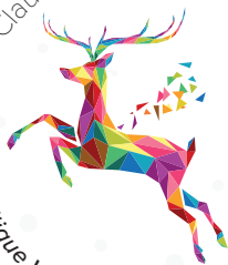
Prix de la critique Valéry-Larbaud