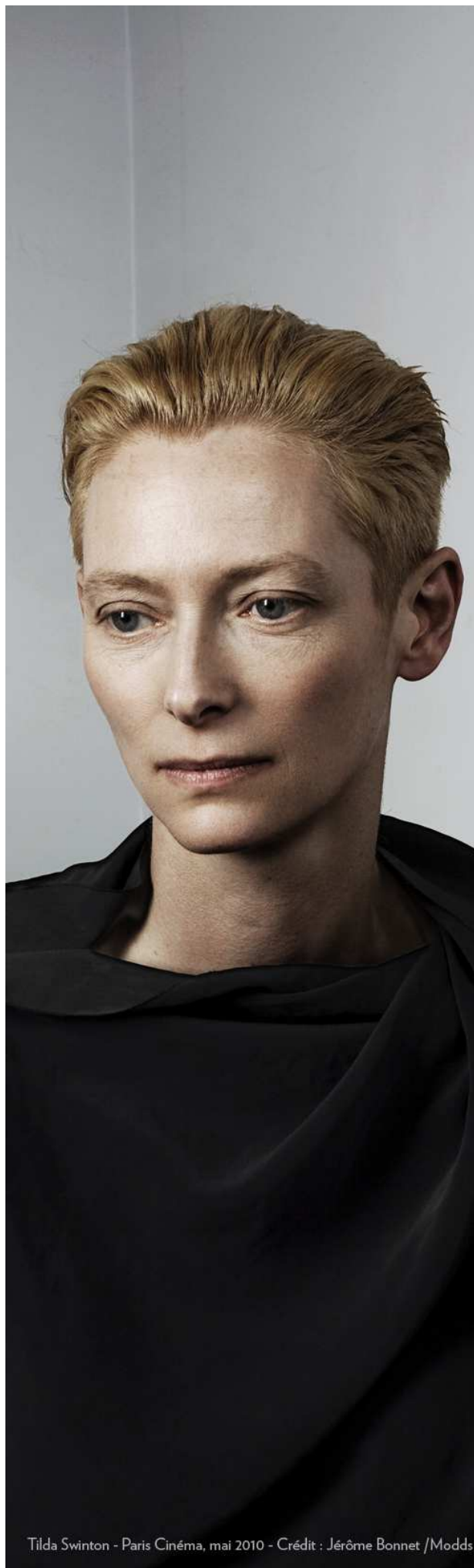
Tilda Swinton - Paris Cinéma, mai 2010

→ Source de l'Hôpital • Juillet-août (dates à confirmer) • 06 83 17 49 63 • www.albert-londres-vichy.fr