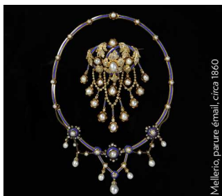
Mellerio, parure émail, circa 1860

Pour fêter ses 400 ans, la prestigieuse Joaillerie vous dévoile, au travers de pièces uniques et d'archives historiques, les créations incroyables, imaginées pour offrir à l'Impératrice Eugénie des parures à nulle autre pareilles, chargées d'émotion et de sensibilité.