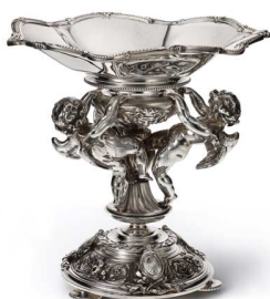
Christofle, coupe aux 3 putti