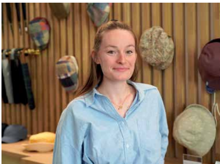
Soupçon d'élégance Fer à cheval Accessoires de mode