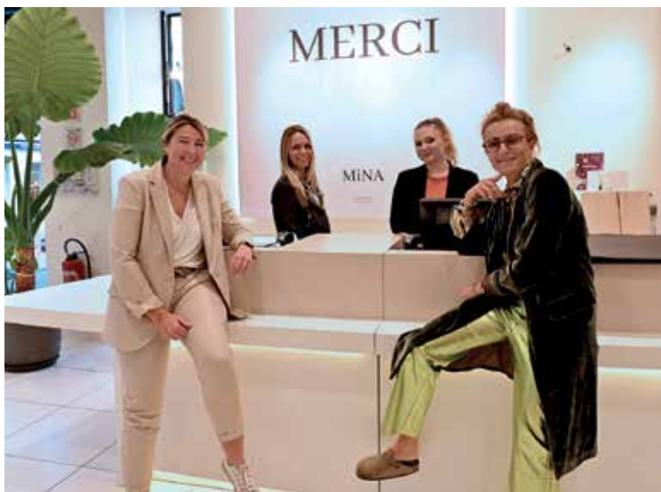
Mina 6, 8 rue Clemenceau Prêt-à-porter