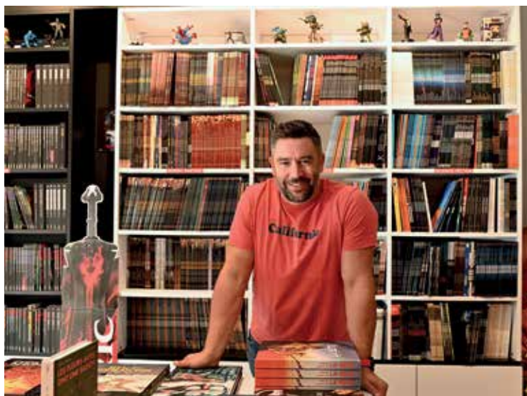
BD Fugue 37 rue de Paris Librairie