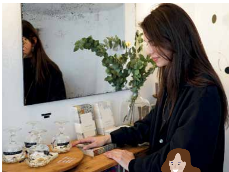
Verdandi 1 rue du Président Roosevelt Produits de beauté, concept-store